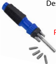
Destornillador de Puntas Múltiples SKU 3R5EFM2